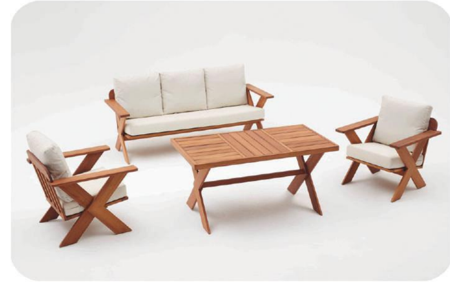
Kestane Bahçe Mobilyası | Edremit Chestnut Wood Outdoor Furniture | Edremit

" Daha fazla ürün çeşidi için web sitemizi ziyaret edebilirsiniz. " www.ravilla.com.tr