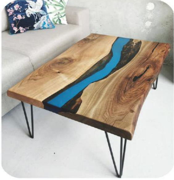
Epoksili Ceviz Masa | Göksu Walnut Epoxy Coffee Table | Göksu