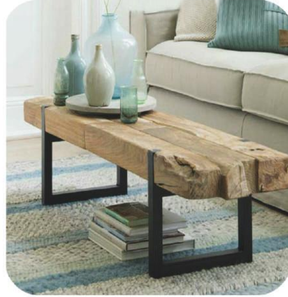
Eskitme Sedir Sehpa | Demre Rustic Cedar Coffee Table | Demre

" Daha fazla ürün çeşidi için web sitemizi ziyaret edebilirsiniz. " www.ravilla.com.tr