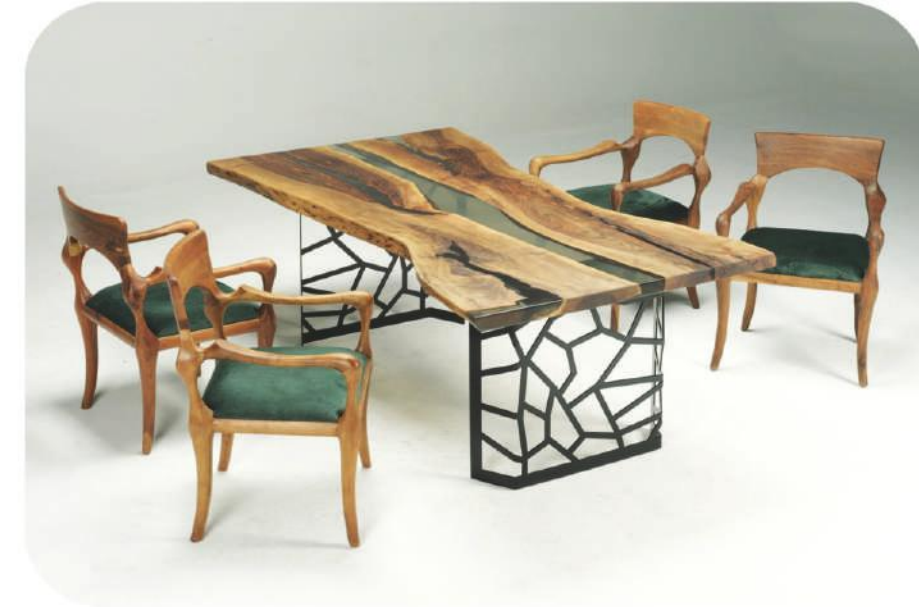
Ceviz Epoksi Masa | Fethiye Walnut Epoxy Table |

" Visit our website for more products " www.ravilla.com.tr