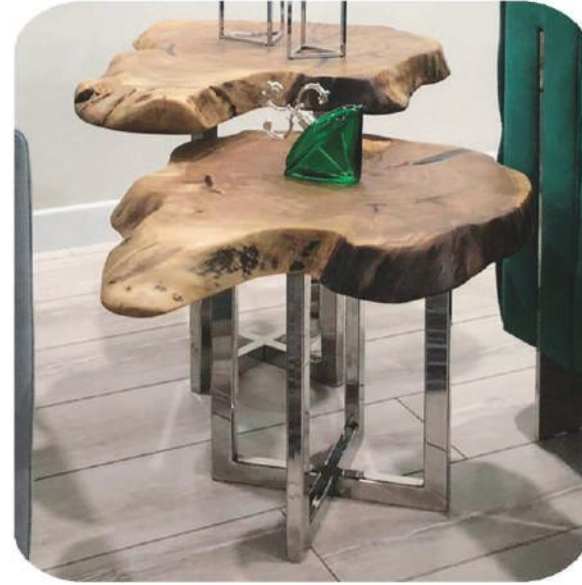
Ceviz Sehpa | Marmaris Walnut Coffee Table |