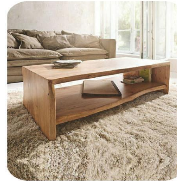
Ceviz Sehpa | Walnut Coffee Table | Karadere