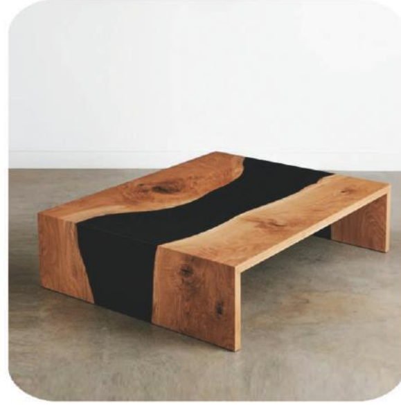
Epoksili Ceviz Sehpa | Kafkas Walnut Epoxy Coffee Table | Kafkas