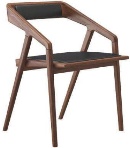
Ceviz Sandalye | Katakana Walnut Chair |