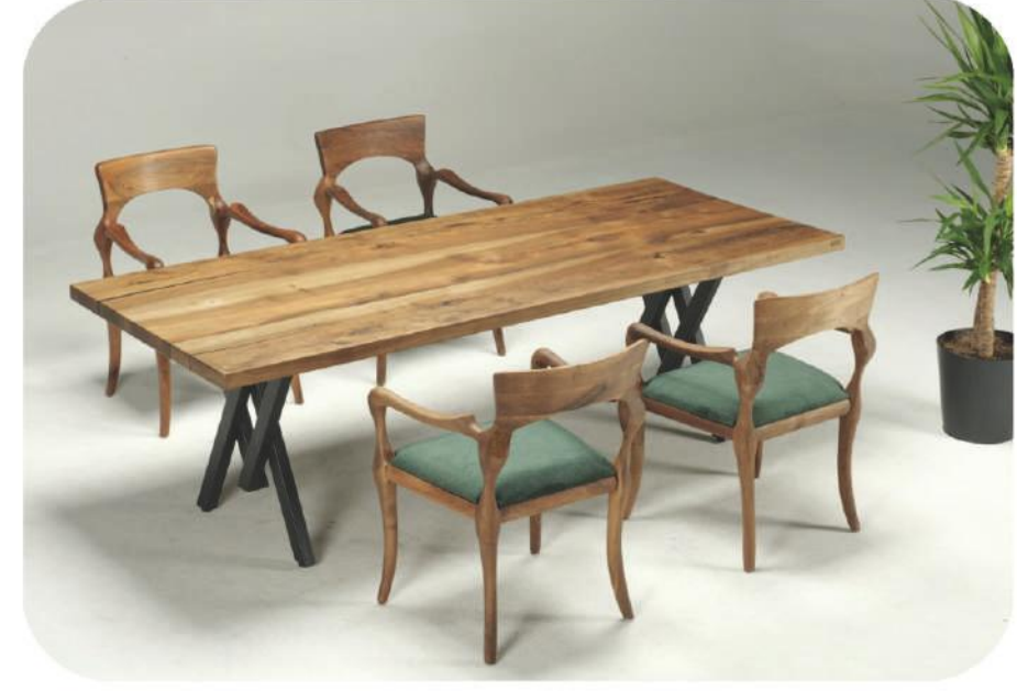
Ceviz Masa | Walnut Table | Birgi

" Daha fazla ürün çeşidi için web sitemizi ziyaret edebilirsiniz. " www.ravilla.com.tr