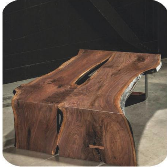
Ceviz Sehpa | Karacaören Walnut Coffee Table |