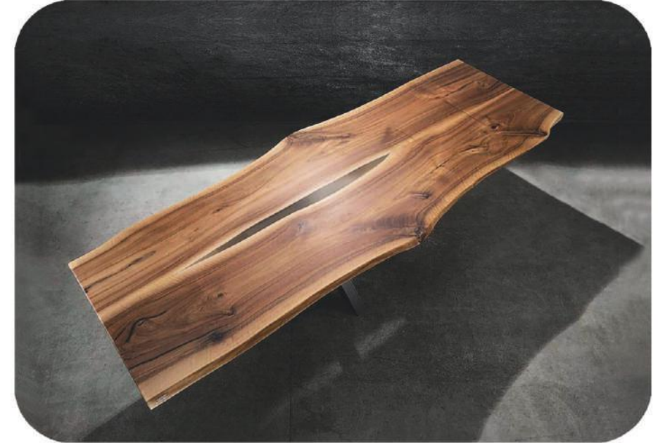
Ceviz Epoksi Masa | Faselis Walnut Epoxy Table | Faselis

" Visit our website for more products " www.ravilla.com.tr