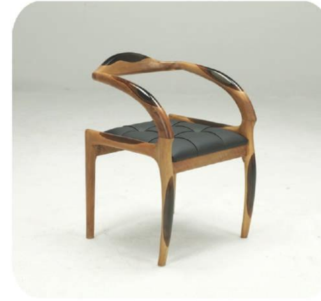
Ceviz Epoksi Sandalye | Meriç Walnut Epoxy Chair | Meriç