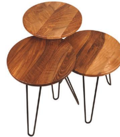
Ceviz Zigon Sehpa | Horosan Walnut Side Coffee Table |