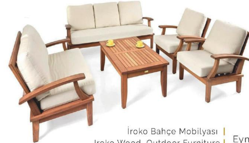
İroko Bahçe Mobilyası | Eymir Iroko Wood Outdoor Furniture | Eymir