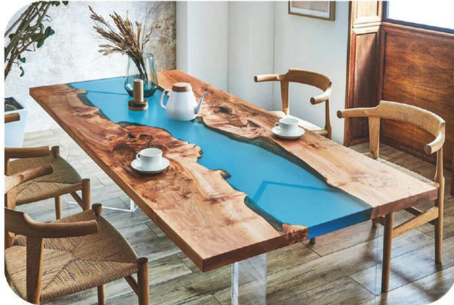
Ceviz Epoksi Masa | Karadeniz Walnut Epoxy Table |

" Daha fazla ürün çeşidi için web sitemizi ziyaret edebilirsiniz. " www.ravilla.com.tr