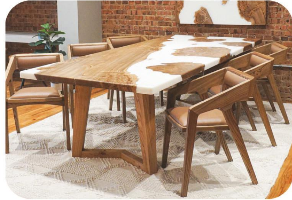
Beyaz Epoksi Ceviz Masa | Alaçatı Walnut Epoxy Table |

" Daha fazla ürün çeşidi için web sitemizi ziyaret edebilirsiniz. " www.ravilla.com.tr