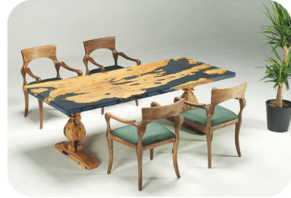
Zeytin Epoksi Masa | Belek Olive Epoxy Table |