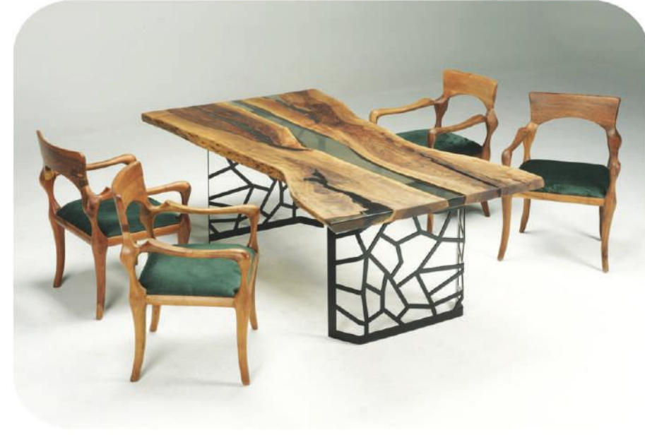
Ceviz Epoksi Masa | Fethiye Walnut Epoxy Table |