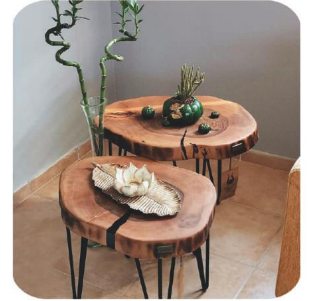
Yuvarlak Ceviz Sehpa | İkizce Walnut Side Coffee Table |