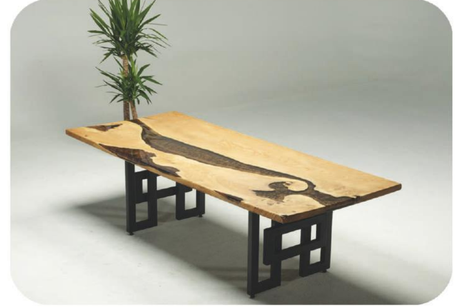
Dişbudak Masa | Patara Ash Table | Patara

" Daha fazla ürün çeşidi için web sitemizi ziyaret edebilirsiniz. " www.ravilla.com.tr