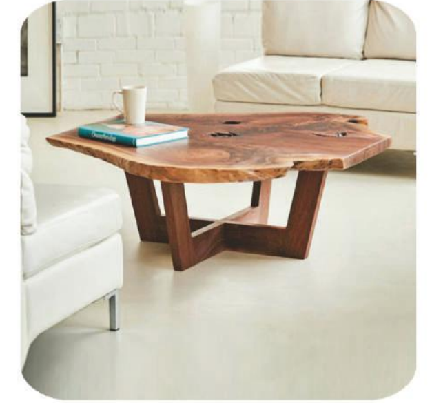
Ceviz Sehpa | Walnut Epoxy Coffee Table | Ünye

* You can see the quality of our handwork from super clear epoxy of the coffee table.