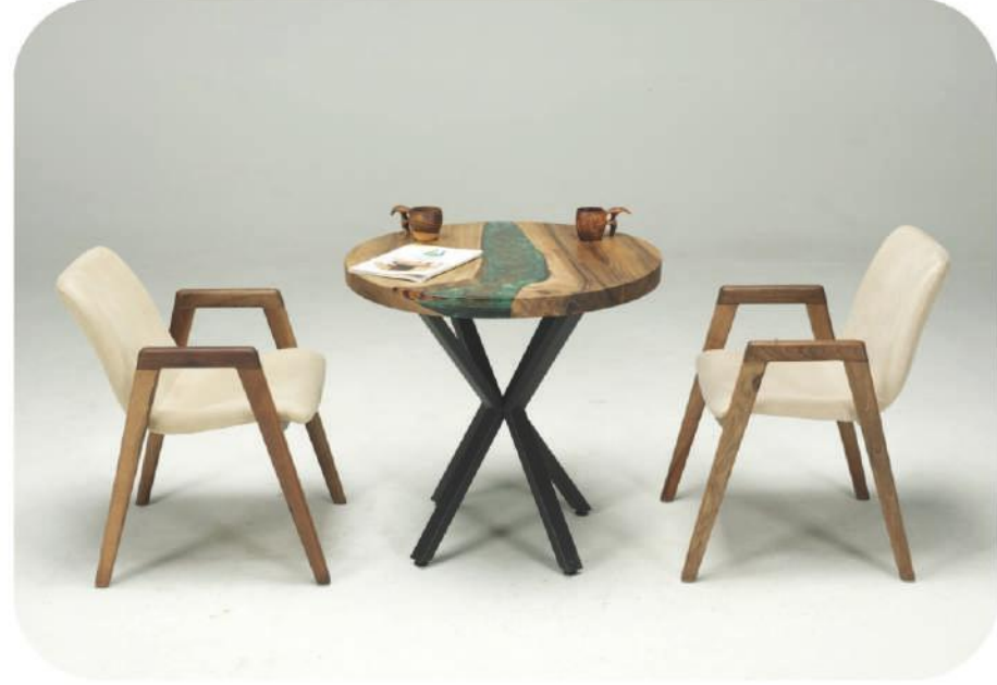
Yuvarlak Ceviz Epoksi Masa | Göreme Walnut Round Epoxy Table | Göreme