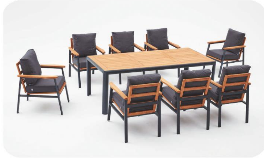
Alüminyum & İroko Bahçe Mobilyası | Göcek Aluminium & İroko Wood Outdoor Furniture | Göcek

* The garden furniture set is available for indoor and outdoor use.