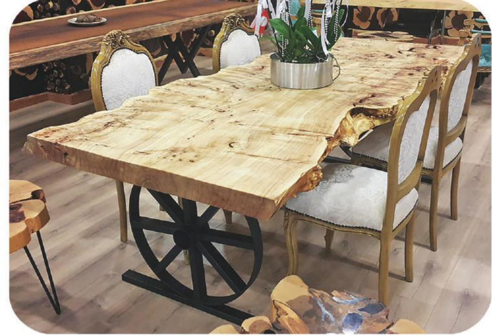
Mazel Masa | Serik Mappa Burl Table |

" Visit our website for more products " www.ravilla.com.tr