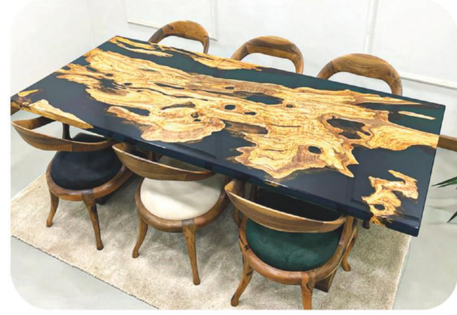
Zeytin Epoksi Masa | Myra Olive Epoxy Table |

" Daha fazla ürün çeşidi için web sitemizi ziyaret edebilirsiniz. " www.ravilla.com.tr