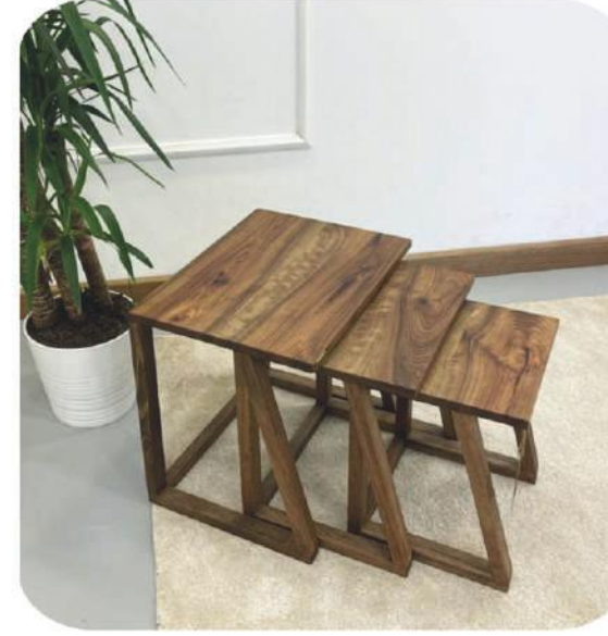
Ceviz Ahşap Zigon Sehpa | Maçka Walnut Side Coffee Table |