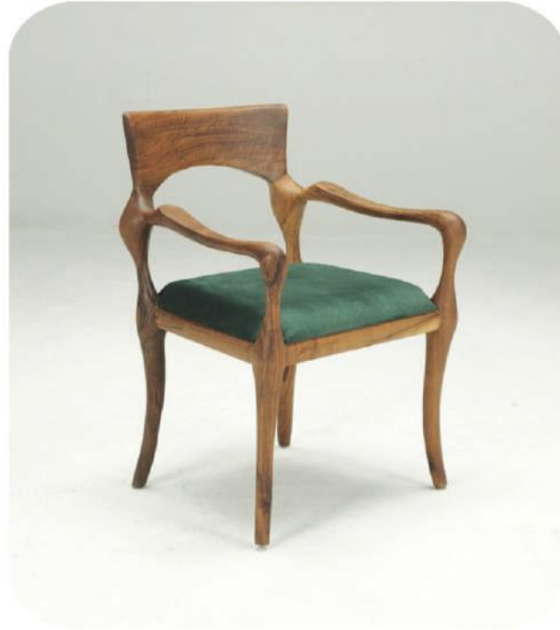
Ceviz Sandalye | Termessos Walnut Chair | Termessos