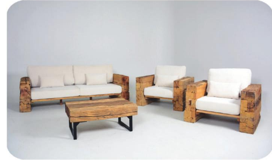
Kestane Bahçe Mobilyası | Troya Chestnut Wooden Outdoor Furniture | Troya

* The outdoor furniture is for indoor and outdoor use. * Not recommended for rain and wet areas.