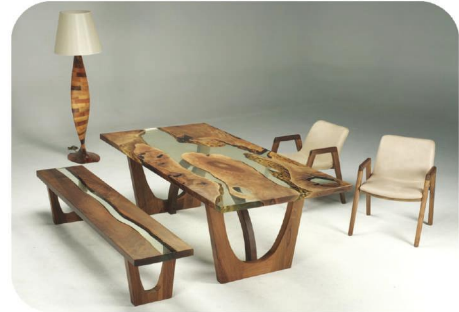
Ceviz Epoksi Masa | Gelibolu Walnut Epoxy Table |