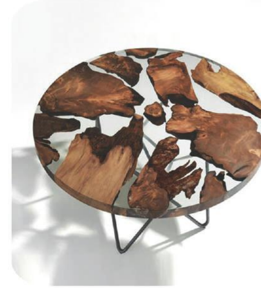
Ceviz Epoksi Sehpa | Walnut Epoxy Coffee Table | Ihlara

* The wood which will be used in making furniture shouldn't be prone to contain bacterias, worms or insects. Wood species are very important in making furniture. Not every wood species can be used for making every furniture.