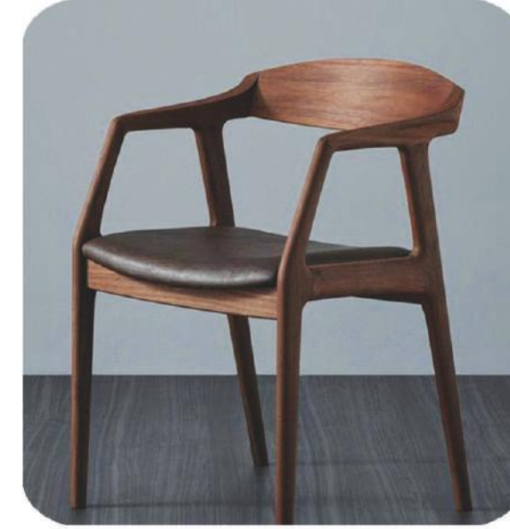
Ceviz Sandalye | Tortum Walnut Chair |

* This chair is available for indoor and outdoor use.