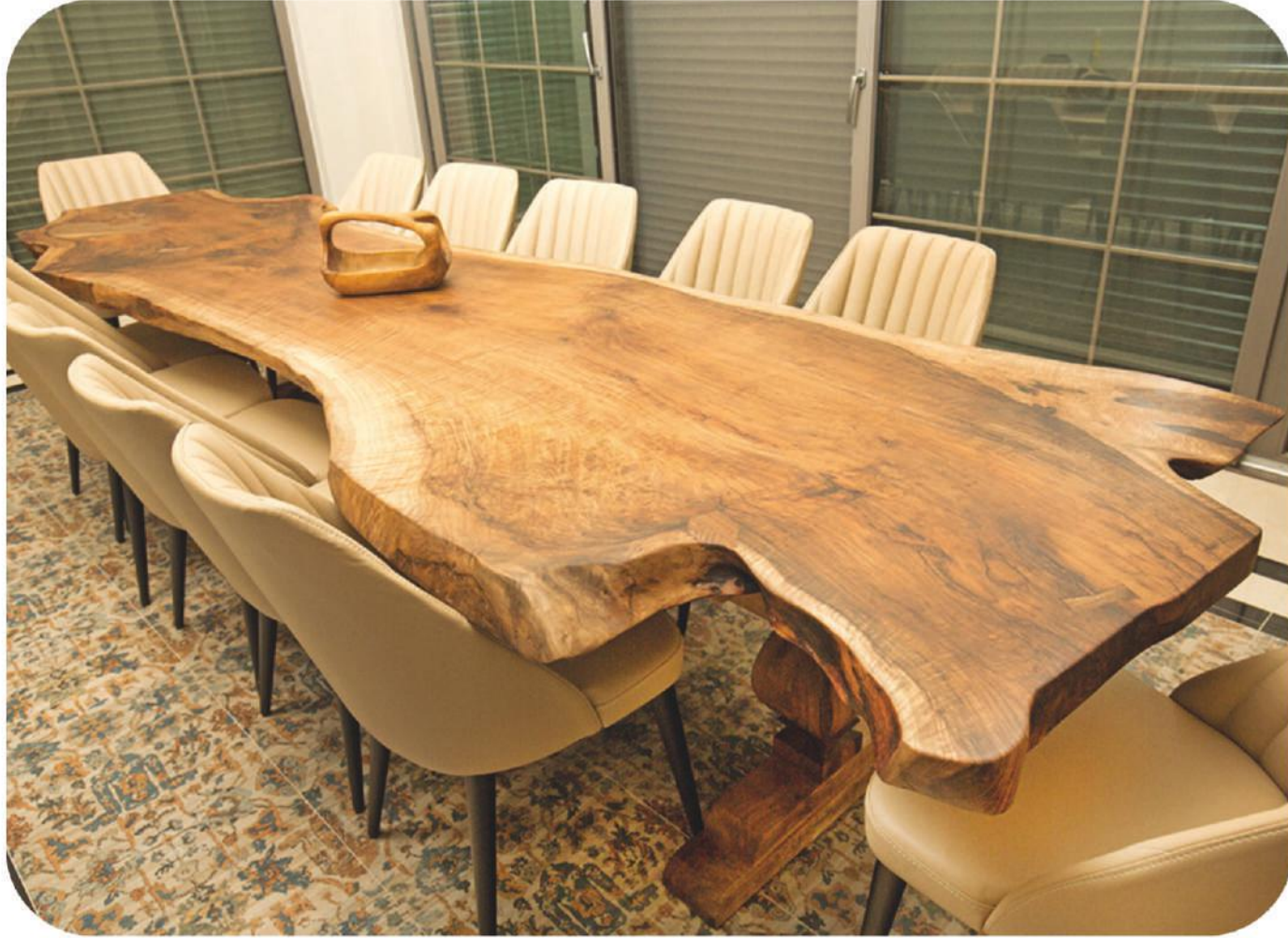
Ceviz Masa | Atalay Walnut Table |