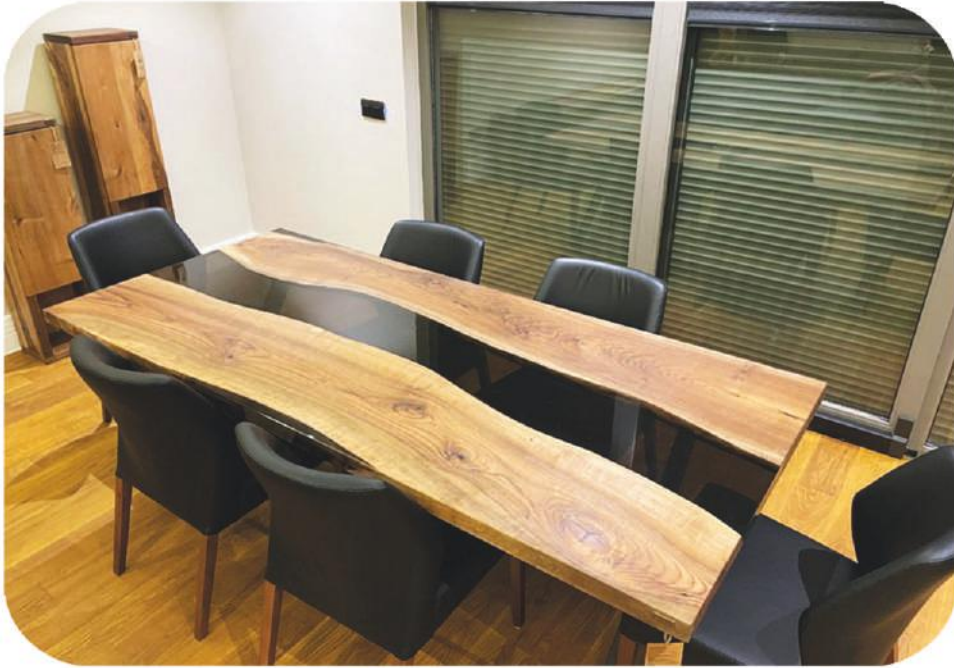
Ceviz Epoksi Masa | Gemile Walnut Epoxy Table |

" Daha fazla ürün çeşidi için web sitemizi ziyaret edebilirsiniz. " www.ravilla.com.tr