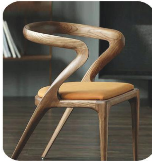
Ceviz Sandalye | Buhara Walnut Chair |