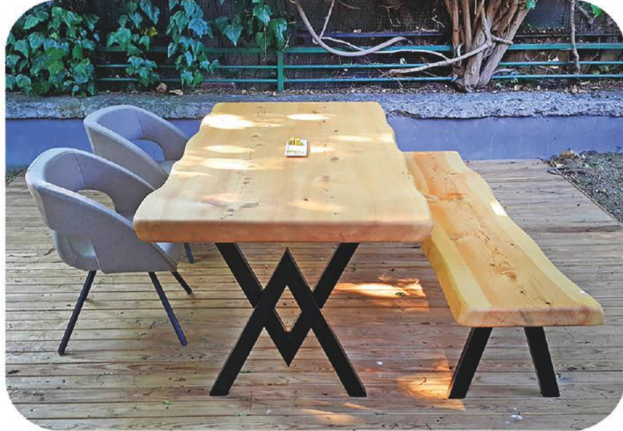
Sedir Masa ve Oturak | Cedar Table and Bench | Alara

" Daha fazla ürün çeşidi için web sitemizi ziyaret edebilirsiniz. " www.ravilla.com.tr