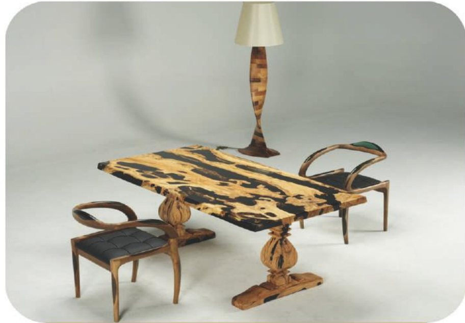
Zeytin Epoksi Masa | Demre Olive Epoxy Table |