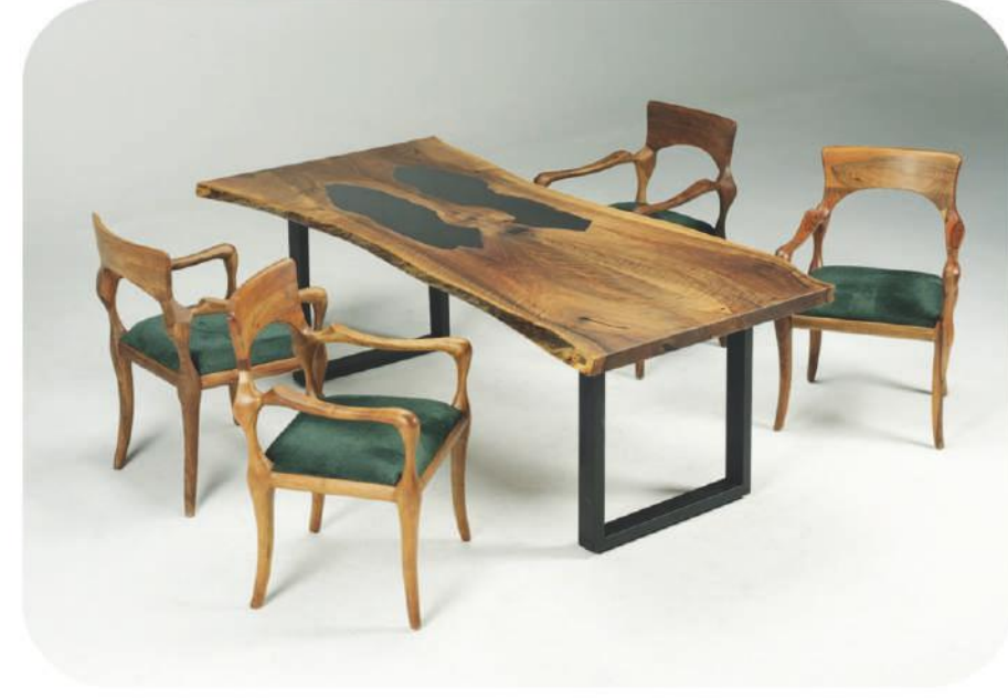
Zeytin Epoksi Masa | Faralya Olive Epoxy Table |