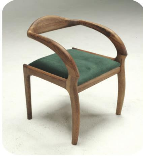
Ceviz Sandalye | Tugan Walnut Chair |