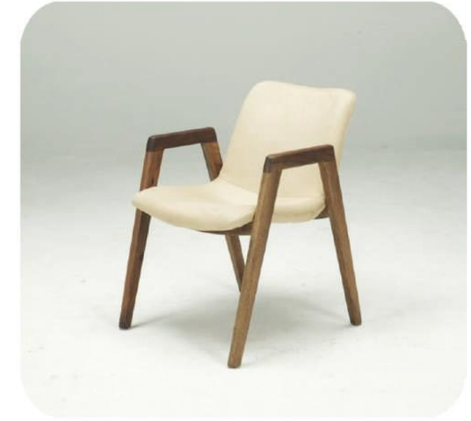
Ceviz Sandalye | Ilgaz Walnut Chair | Ilgaz