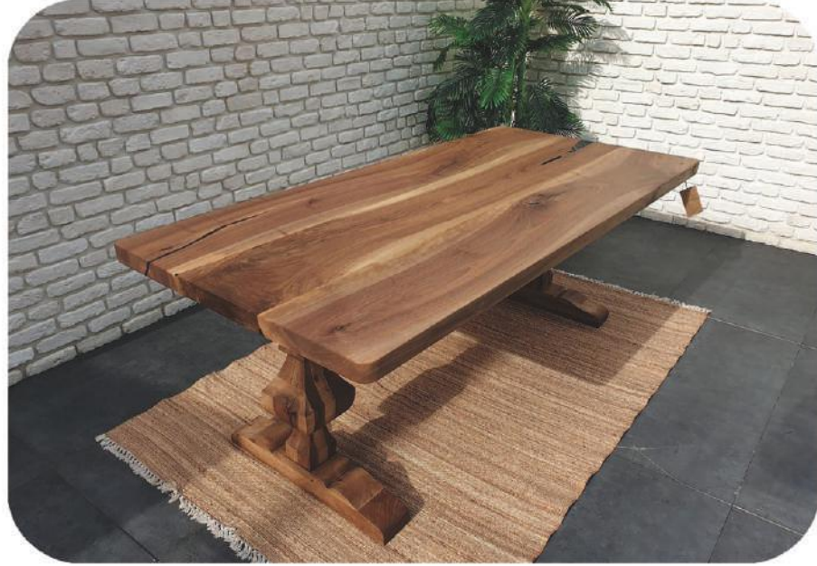
Ceviz Masa | Florya Walnut Table |