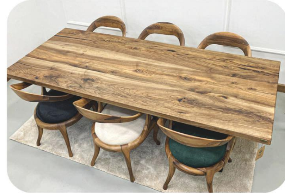
Ceviz Masa | Ziga Walnut Table |

" Daha fazla ürün çeşidi için web sitemizi ziyaret edebilirsiniz. " www.ravilla.com.tr