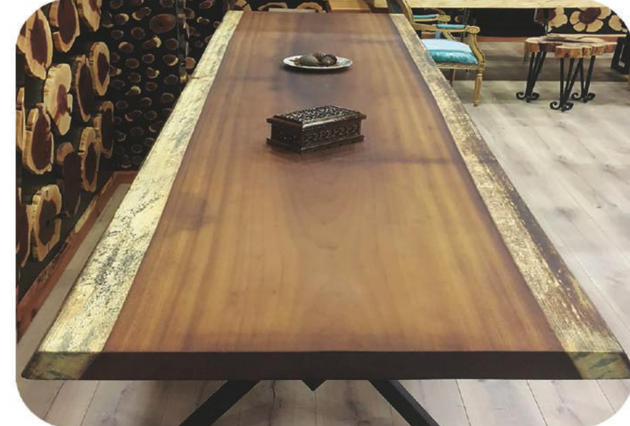
Iroko Masa | Farmella Iroko Table |