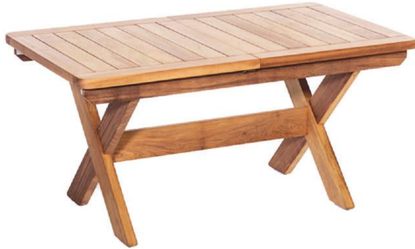
Sedir Masa | Gerence Cedar Table |

* Bu masa yoğun güneş alan yerlerde çatlama ve yamulmalara karşı çok daha dayanıklıdır.