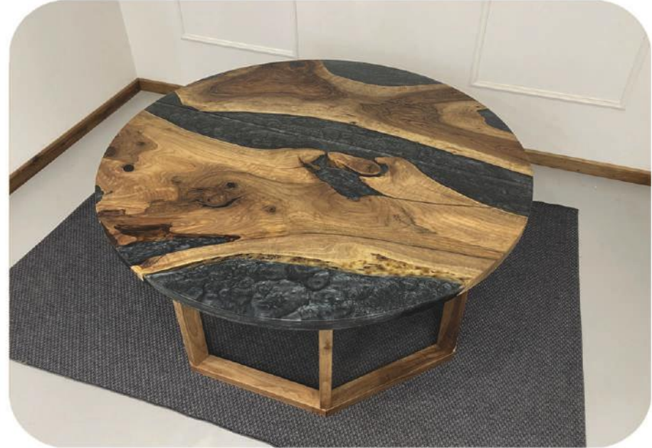
Epoksi Ceviz Masa | Beykoz Walnut Epoxy Table | Beykoz

" Daha fazla ürün çeşidi için web sitemizi ziyaret edebilirsiniz. " www.ravilla.com.tr