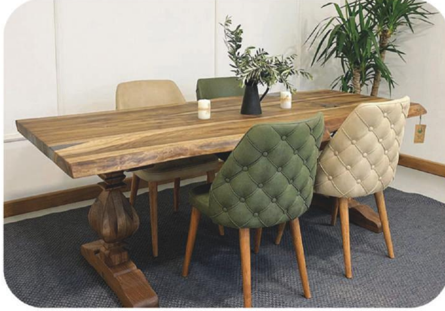
Ceviz Masa | Abant Walnut Table |