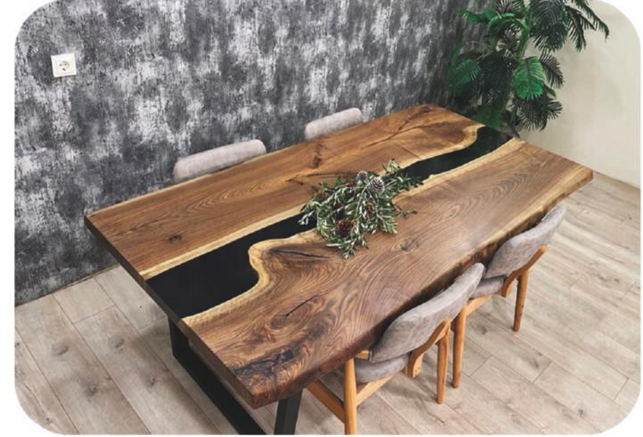
Ceviz Epoksi Masa | Walnut Epoxy Table | Ötüken

" Visit our website for more products " www.ravilla.com.tr