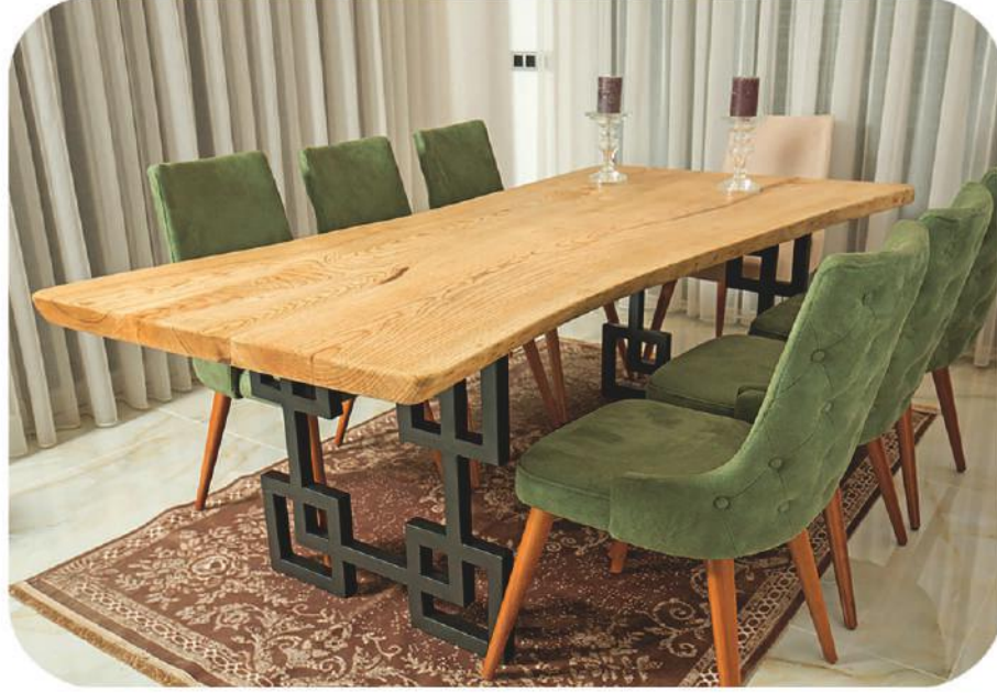
Dişbudak Masa | Ash Table | Finike