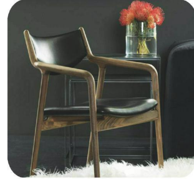
Ceviz Sandalye | Midas Walnut Chair | Midas

Very few companies in the world make walnut wood chairs. They are all hand made, unique and luxury chairs. Mostly birch wood is used in manufacturing wooden chairs which don't match with walnut and olive wood tables or walnut wood furniture. This is why we make walnut wooden chairs. Buying walnut wooden chairs for your walnut wood tables or walnut wooden furniture will make a stunning concept at your places.