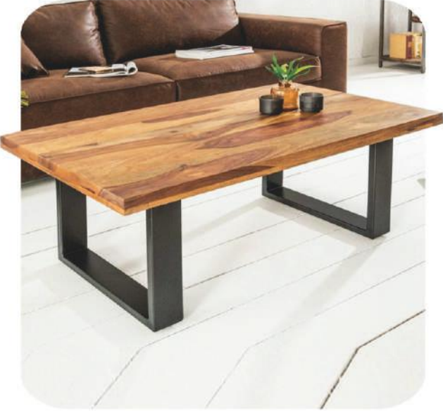
Ceviz Sehpa | Alarahan Walnut Coffee Table | Alarahan