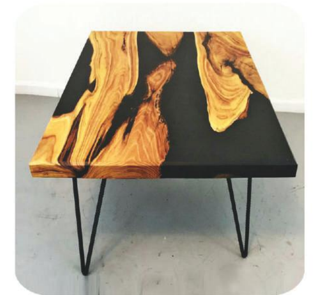
Zeytin Epoksi Sehpa | Olive Epoxy Coffee Table | Bergama