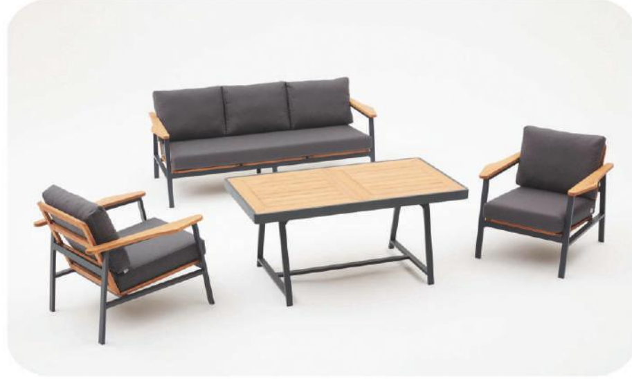
Alüminyum & İroko Bahçe Mobilyası | Salda Aluminium & İroko Wood Outdoor Furniture | Salda