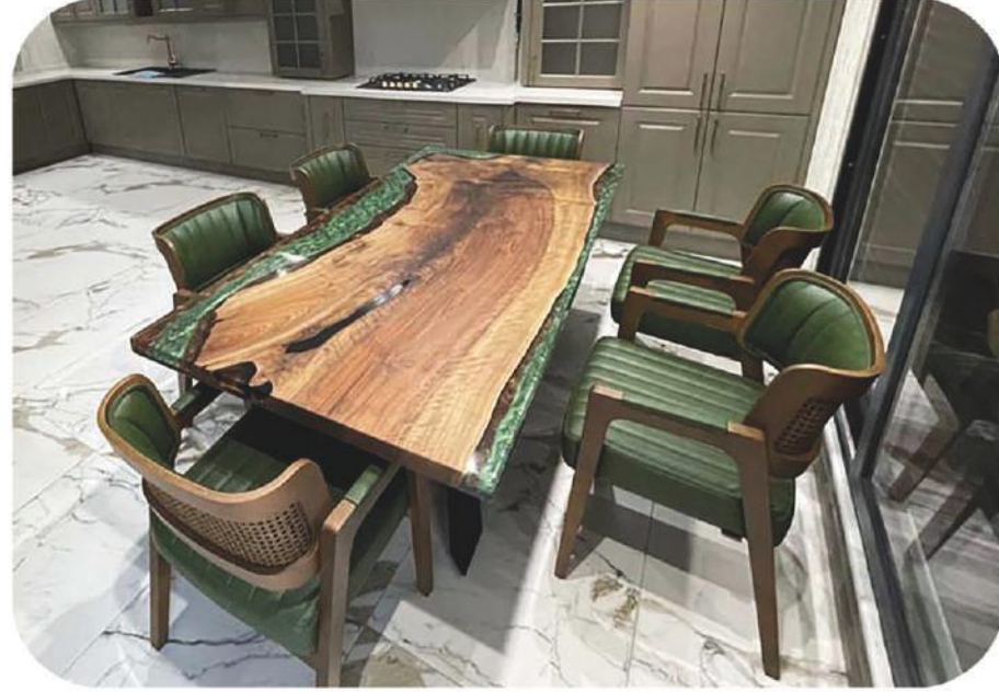
Ceviz Epoksi Masa | Milas Walnut Epoxy Table |