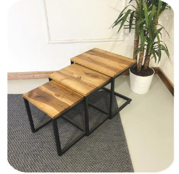
Ceviz 3lü Zigon Sehpa | Altay Walnut Side Coffee Table |