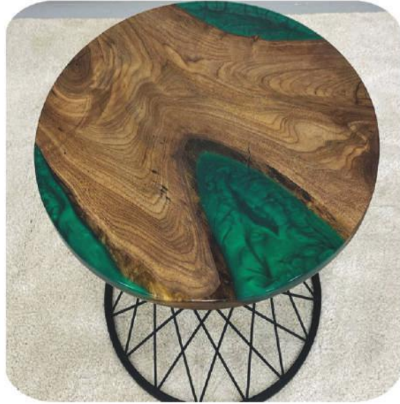
Epoksili Ceviz Sehpa | Belkıs Walnut Epoxy Table |