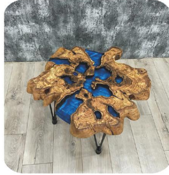
Epoksili Zeytin Masa | Gediz Olive Epoxy Table |