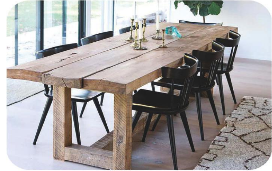
Kafe - Restaurant Masası | Selçuk Cafe and Restaurant Table |

* Bu masa yoğun güneş alan yerlerde çatlama ve yamulmalara karşı çok daha dayanıklıdır.