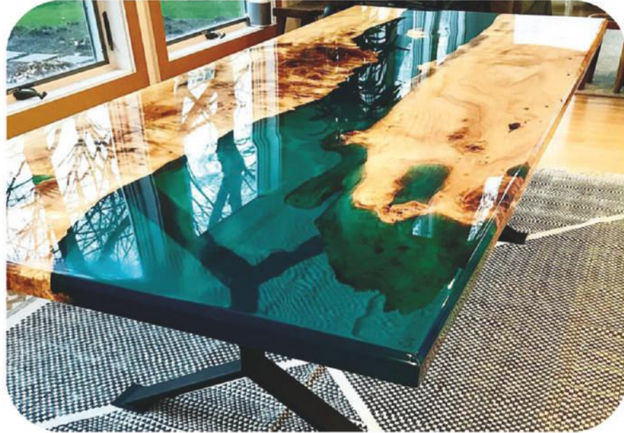
Dişbudak Epoksi Masa | Kozluk Ash Epoxy Table |

" Daha fazla ürün çeşidi için web sitemizi ziyaret edebilirsiniz. " www.ravilla.com.tr